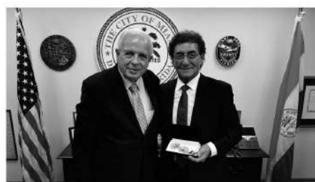
Mayor de Miami Tomas Regalado y Dr. Jorge Abuchalja.

Bone, representantes de la Cámara Uruguay Estados Unidos, delegación de empresarios uruguayos y más de 300 invitados.