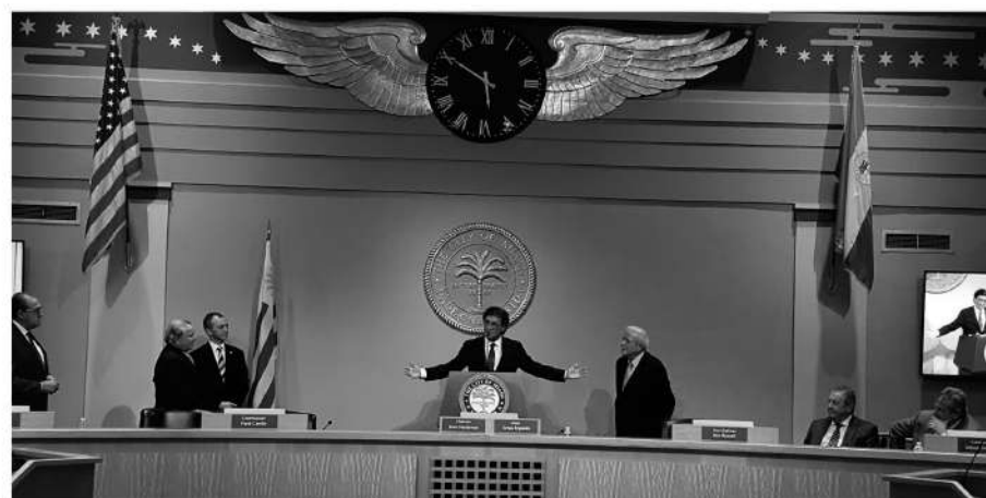
Conferencia brindada por el Dr. Jorge Abuchalja en el Palacio Municipal de la Alcaldía de Miami en la entrega de la llave de ciudad.