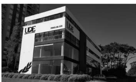
Nueva sede Av. Roosevelt Parada 7, reluciente y resplandeciente.

Esta acción al igual que la alcanzada en Colonia del Sacramento en la graduación de la primer