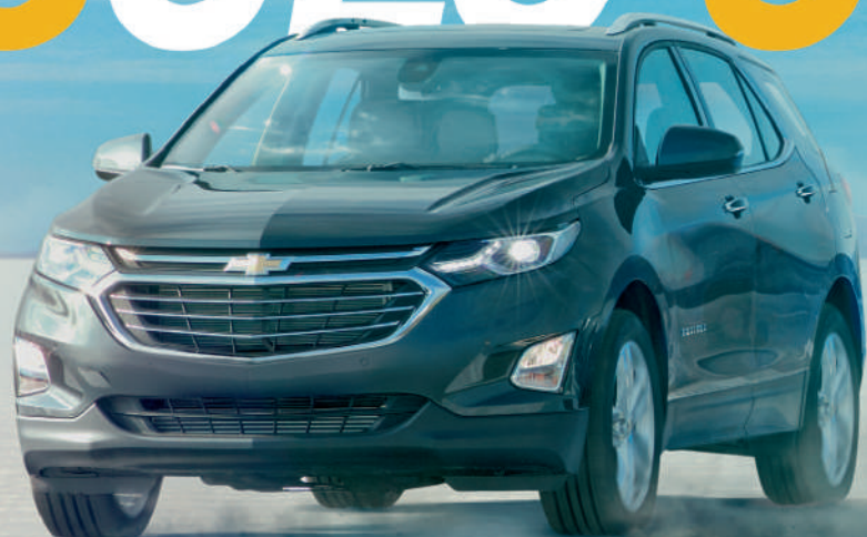
NUEVA CHEVROLET EQUINOX