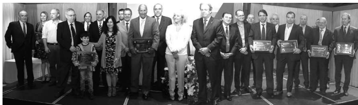
Asociados homenajeados por la CIU.

emprendedurismo. Y agregó que "la industria del futuro será inteligente, o no será". Y que desde el Ministerio se continuará trabajando en clave de cooperación, análisis y acción, "para proteger la industria nacional, ayudarla a cambiar y generar la nueva industria nacional".