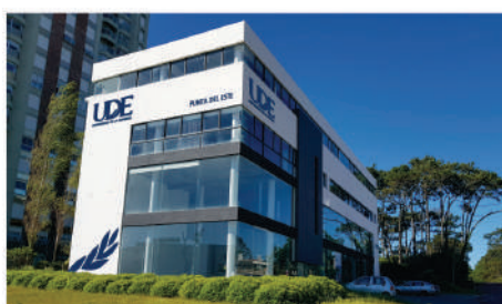
Nueva sede Av. Roosevelt Parada 7, reluciente y resplandeciente.

Esta acción al igual que la alcanzada en Colonia del Sacramento en la graduación de la primer