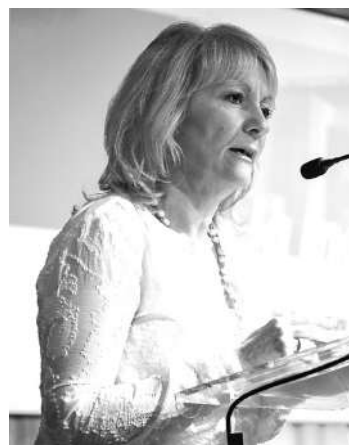
Ministra de Industria, Energía y Minería, Ing. Carolina Cosse.

el proyecto de país productivo que todos tenemos en mente". Por su parte, la Ministra mencionó las iniciativas que ha apoyado el Ministerio, en conjunto también con la Cámara de Industrias, promoviendo la calidad, la innovación, la investigación científica y el