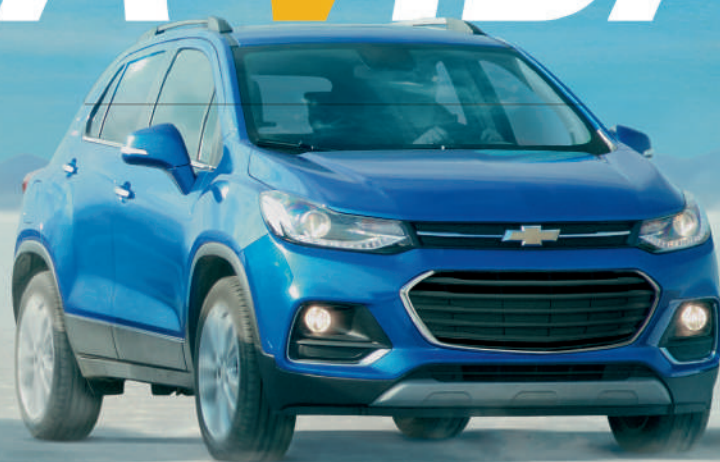
NUEVA CHEVROLET TRACKER

ACERCATE HOY A TU CONCESIONARIO CHEVROLET