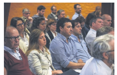
Asistieron autoridades institucionales, empresas, consultores y prensa.