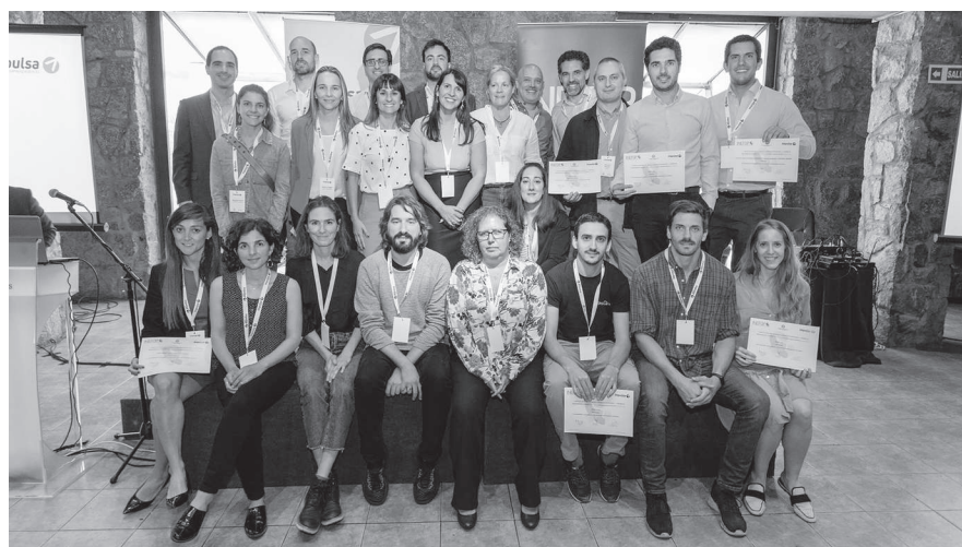
Los emprendimientos acelerados reciben su diploma de participación

impulsaemprendimiento@ciu.com.uy www.impulsaindustria.com.uy/emprendimiento