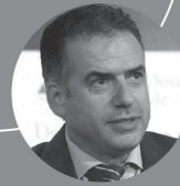
Prof. Yamandú Orsi Intendente de Canelones

Miércoles 3 de noviembre - 9:00 hs Informes y reservas: 2902 5611* / 098 788 999