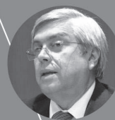
Prof. Tabaré Viera Ministro de Turismo

Perspectiva del turismo en la próxima temporada