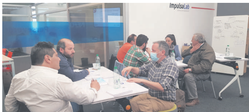
Empresarios analizan posibles retos de innovación industrial.

innovación sistematización y seguimiento” comentó el consultor.